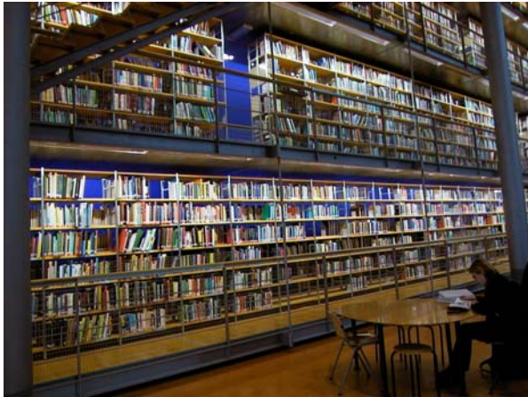
Fig. 2: Boekenkast van 7x3 meter, als informatie-equivalent van het menselijk genoom

Een levende cel kan beschouwd worden als een volledig geautomatiseerde biochemische robot, die bestuurd wordt door een DNA-programma. In een organisme bevat elke cel hetzelfde